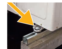
Gummipuffer helfen, den Körperschall zu reduzieren.