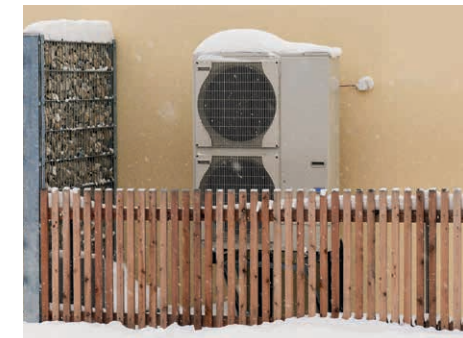
Luft-Wärmepumpe mit Lärmschutz