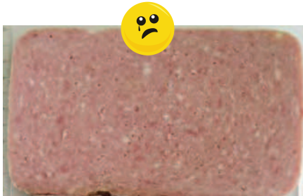
Aussehen: wie Brühwurst

Häufig finden in der Gastronomie Erzeugnisse Verwendung, die einen grundlegend anderen Charakter hinsichtlich Aussehen und Fleischanteil als die unter 1 bis 3 beschriebenen Produkte aufweisen. Es handelt sich nicht mehr um „Schinken“, „Vorderschinken“ oder „Formfleisch(vorder)schinken“, sondern um Erzeugnisse eigener Art . Diese sehen z. B. so aus: