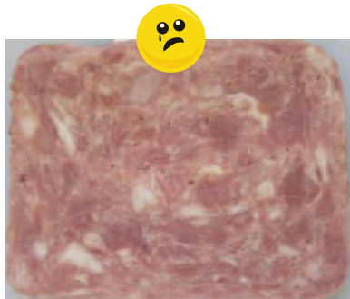
Aussehen: wie Schweinefleisch-konserve

Fleischanteil: 55 % Zuges. Wasser: 34 % Stärke: 5 %