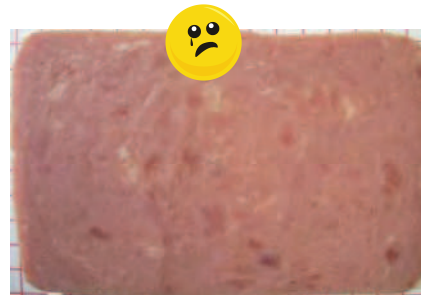
Aussehen: wie Corned Beef

Fleischanteil: 56 % Zuges. Wasser: 29 % Stärke: 12 %